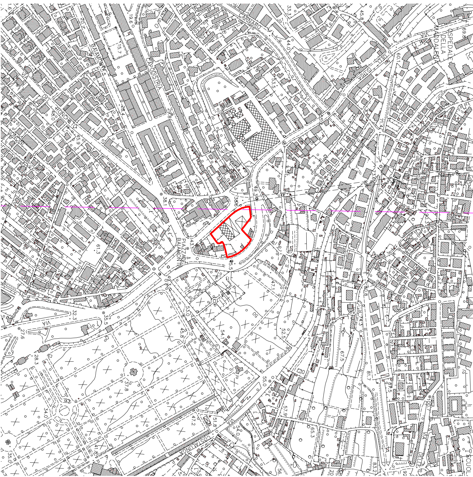
ESTRATTO C.T.R. - scala 1:5.000 110141 TRIESTE SUD - EST 110144 TRIESTE SUD - OVEST