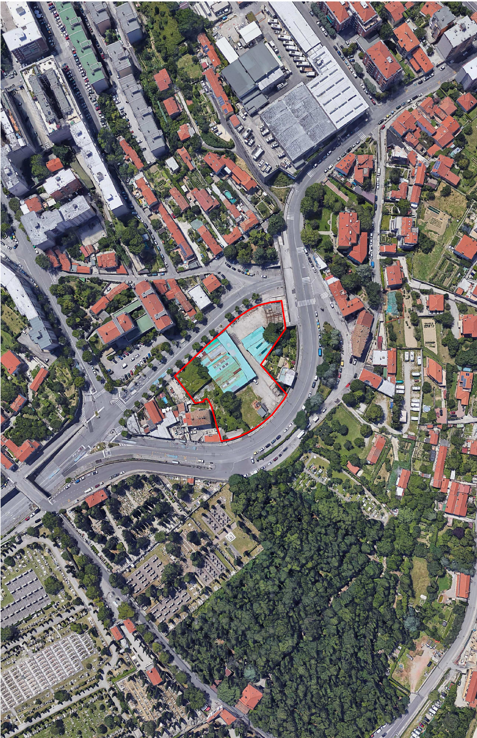
AEROFOTOGRAMMETRIA ESTRATTO GOOGLE EARTH