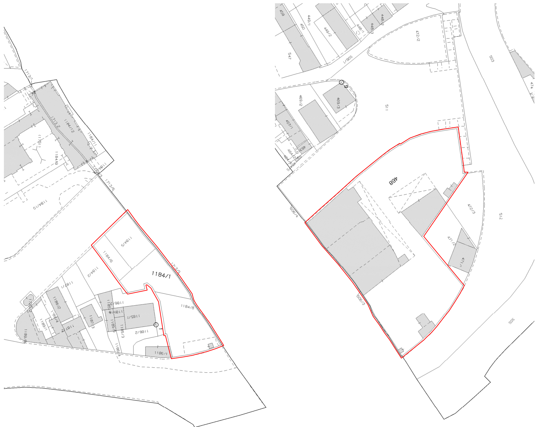
ESTRATTO MAPPA CATASTALE - scala 1:1.000